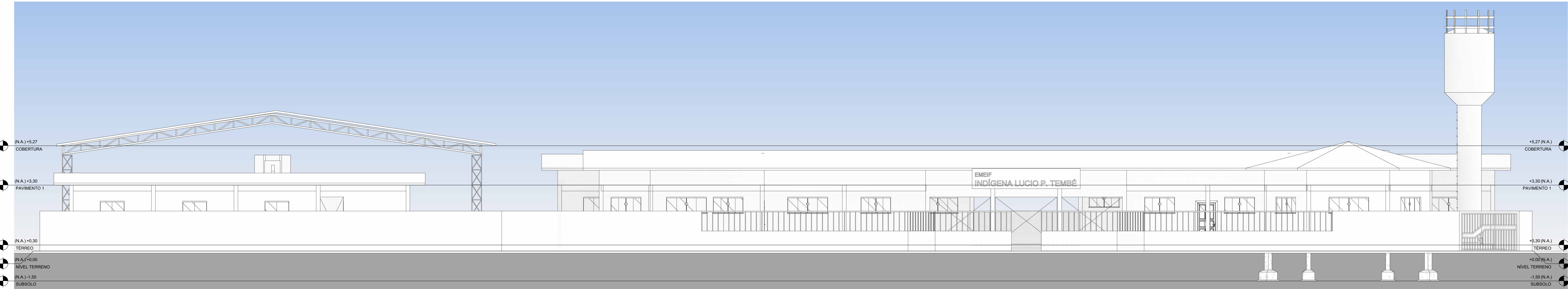
2 FACHADA PRINCIPAL