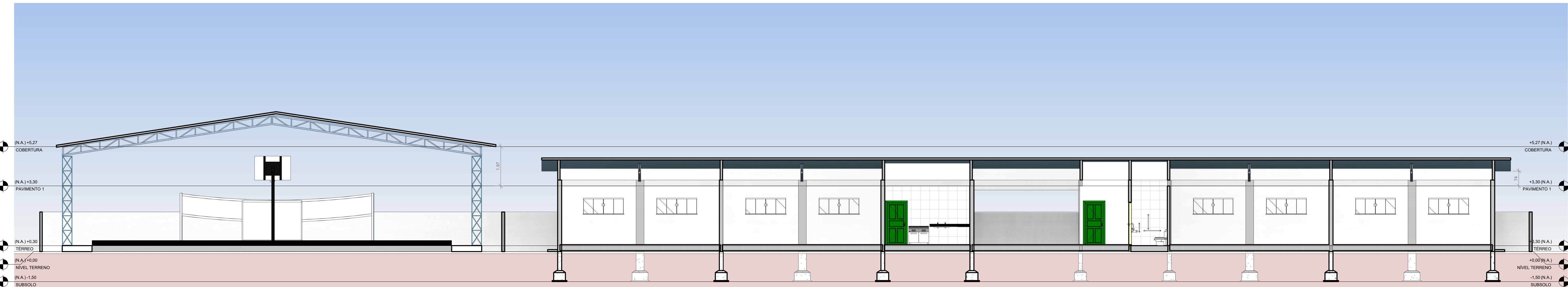
3 CORTE B